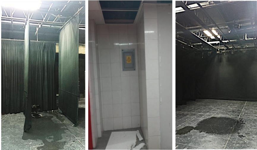
6.- Sala Experimental. Filtración y goteras en escenario, plafón del baño desprendido