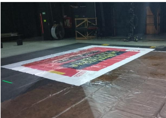
2.- Escenario. Filtración y goteras.

4.2 Afectaciones al Teatro de la Ciudad y al Teatro del Centro de las Artes por lluvias