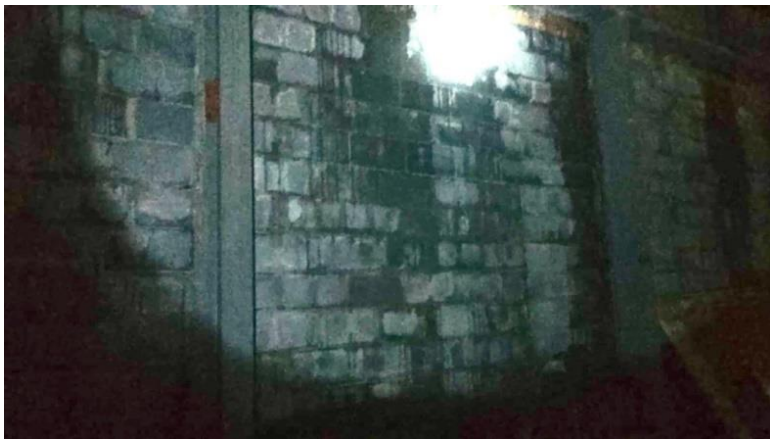
5.- Mezanine camerinos. Filtración en paredes.