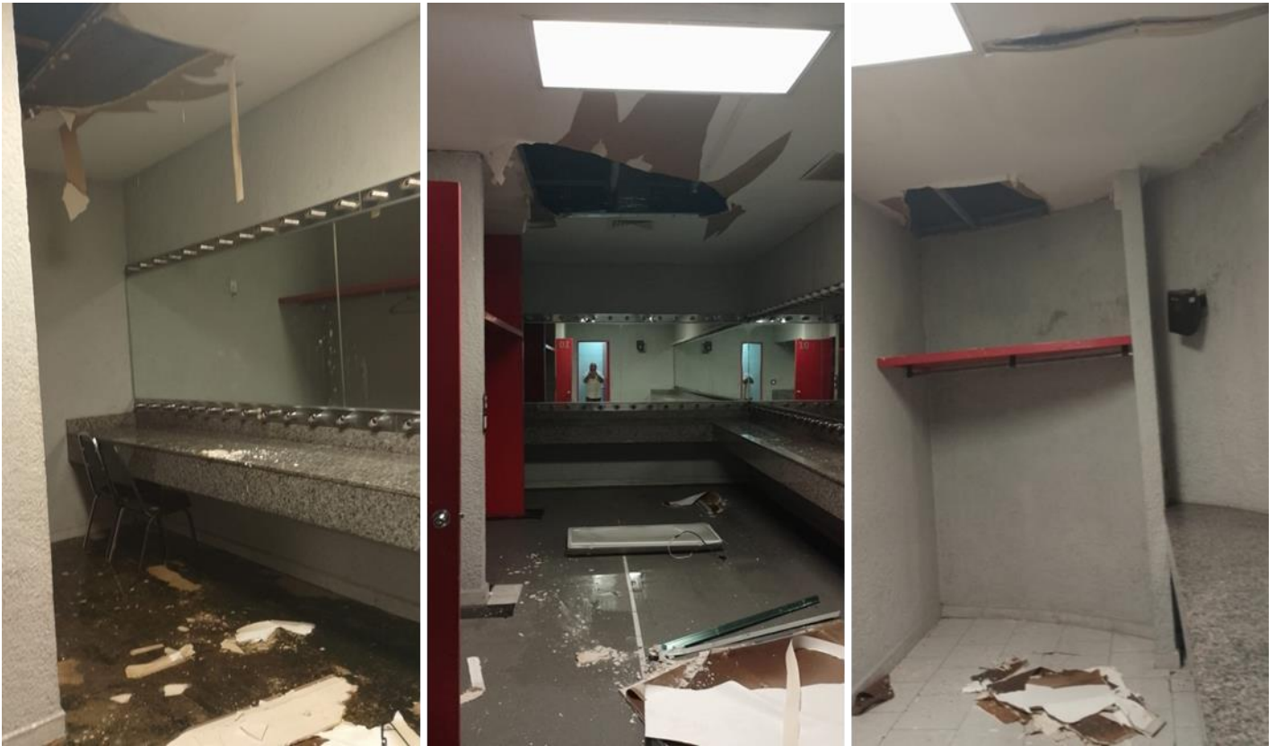
4.- Camerinos. Filtración, goteras, desprendimiento de plafón.