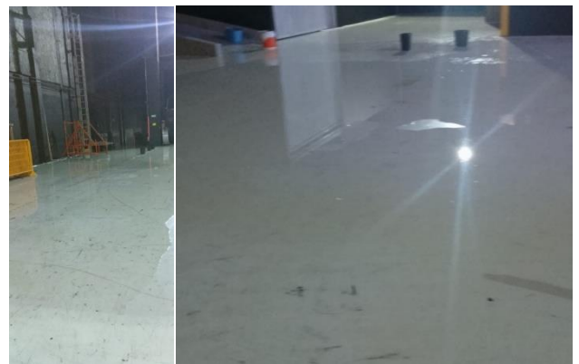
3.- Hombro del Teatro. Filtración y goteras